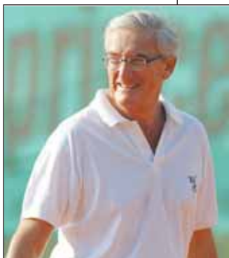
Pier Vittorio Vietti